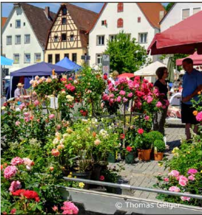
Rosenmarkt in Hersbruck