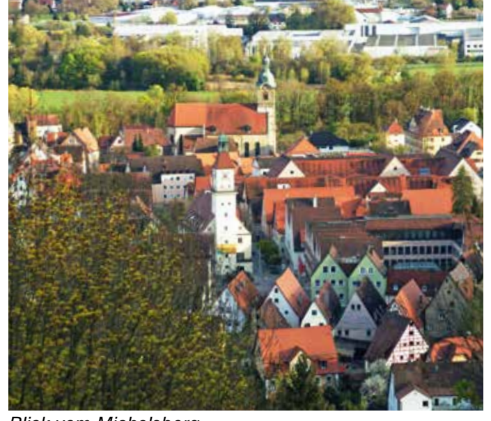
Blick vom Michelsberg