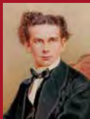
Neues Schloss Herrenchiemsee mit König Ludwig II.-Museum