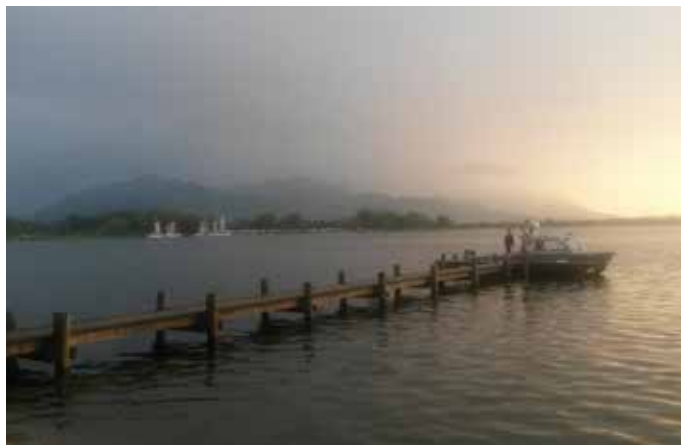
Abendstimmung am Chiemsee

Heimatmuseum Hausenhusl , Weitseestr. 11, +49 8640 80020