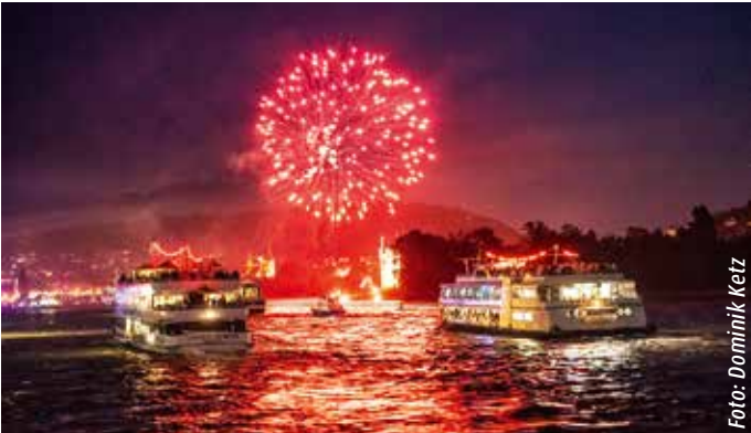
Rhein in Flammen 04. Juli 2026