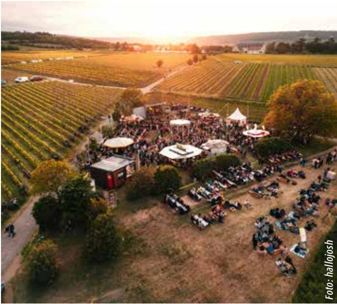
Nacht der Verführung 14.-16. Mai 2026

Oben genannte Einrichtungen und Sehenswürdigkeiten findest du anhand der gelben Ziffernpunkte, die inserierenden Betriebe anhand der roten Ziffernpunkte und Planquadratbezeichnungen in den Anzeigen im Stadtplan.