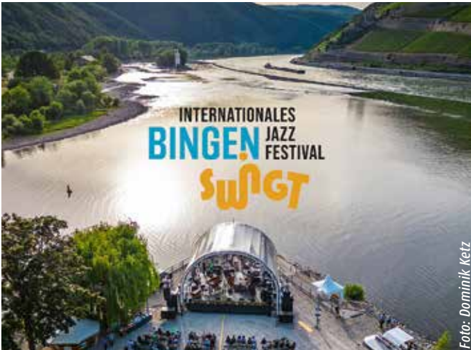
Bingen Swingt – Das internationale Jazzfestival vom 12.-14. Juni 2026

Gut angebunden aus Richtung Koblenz, Frankfurt und Mainz mit Planhalten Bahnhof Bingen (Rh.) Stadt und Bingen (Rh.) Hbf. Bingen (Rh.) Hauptbahnhof, Bingen (Rh.) Stadt und Bingen (Rh.) Gaulsheim