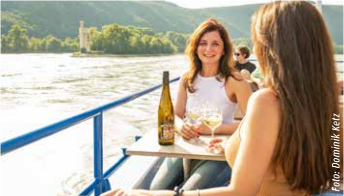
Mit dem Schiff ins Mittelrheintal