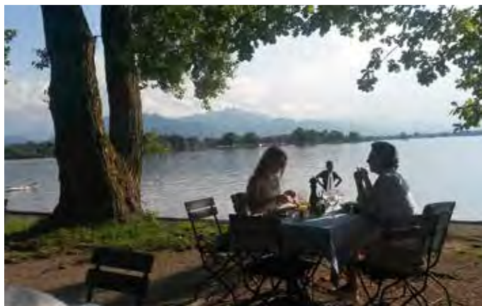
Abendstimmung am Chiemsee

Parker Outdoor , Julius-Exter-Promenade 15 & 23, +49 8642 5955650