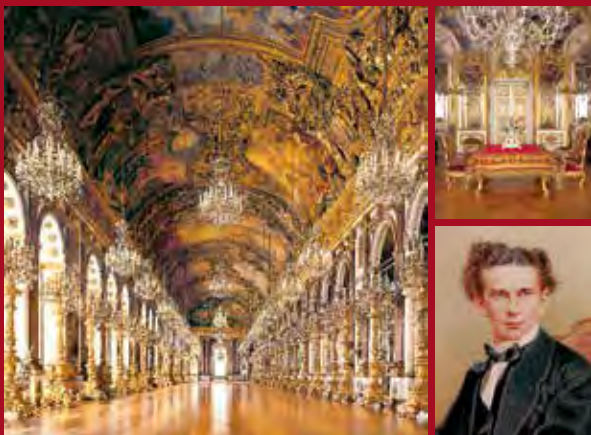
Neues Schloss Herrenchiemsee mit König Ludwig II.-Museum